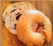
ブルーベリー＆全粒粉