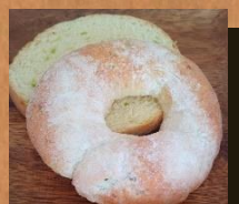
プレミアムうどんだまめ