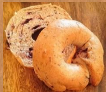
ブルーベリー＆全粒粉