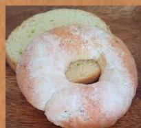
プレミアムえだまめ