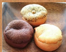
クッキーベーグル チョコ コーヒー プレーン