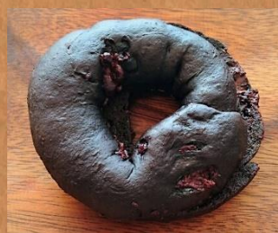
2月限定ベーグル ブラックココア＆チョコレート