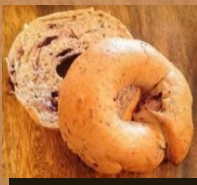
ブルーベリー & 全粒粉