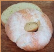
プレミアムえだまめ