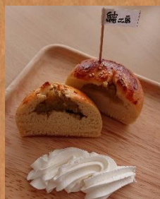
1月限定ベーグル さつまいも