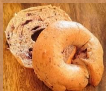
ブルーベリー & 全粒粉