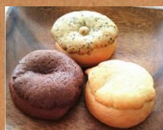
チョコ コーヒー プレーン