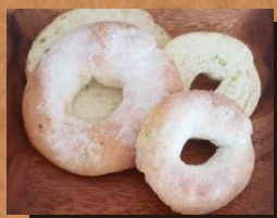
親子ベーグル(普通サイズとミニ) 合計金額の10%off