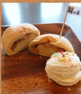
11月限定ベーグル アイス&アップル