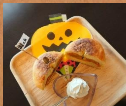
9月限定ベーグル かぼちゃあん