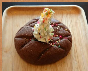
9月限定ベーグル チョコチップメロン