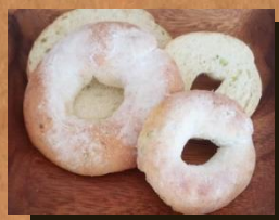
親子ベーグル(普通サイズとミニ) 合計金額の10%off