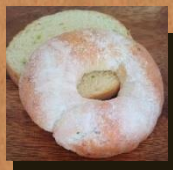
プレミアムえだまめ