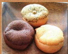
チョコ コーヒー プレーン