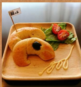
6月限定ベーグル 塩オリーブ