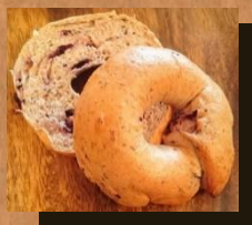
ブルーベリー & 全粒粉