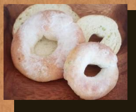
親子ベーグル(普通サイズとミニ) 合計金額の10%off