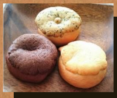
チョコ コーヒー プレーン